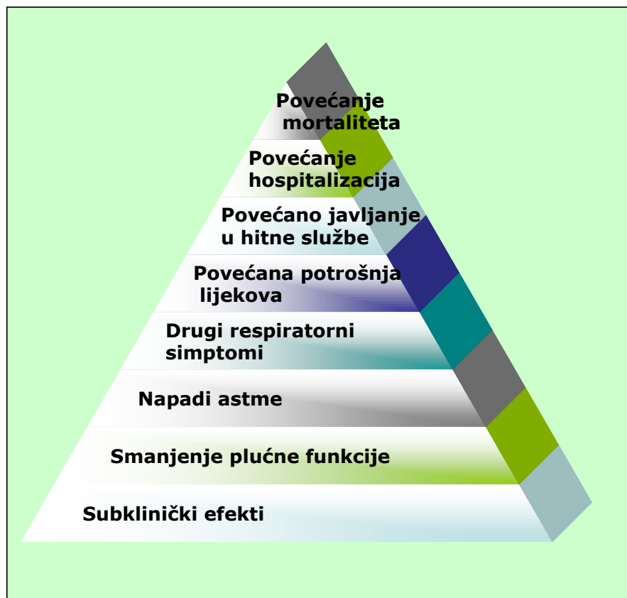
Slika 2. Piramida zdravstvenih efekata onečišćenog zraka.